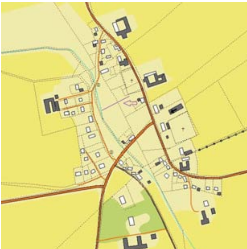
Figur 2. Karta över Hököpinge där undersökningsområdet markerats med pil och heldragen lila linje.