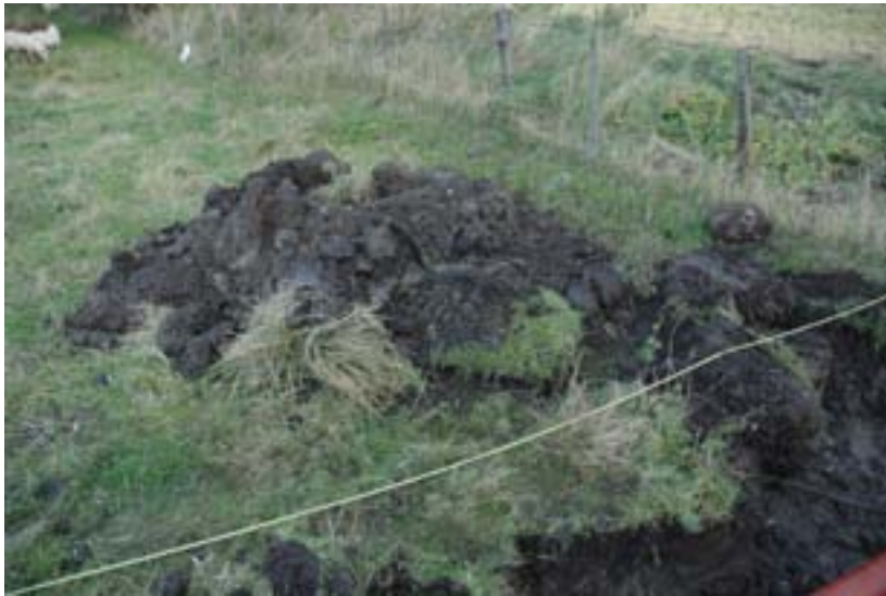
Figur 7 (nederst). Schaktet drogs fram till den å som rinner genom Hököpinge.