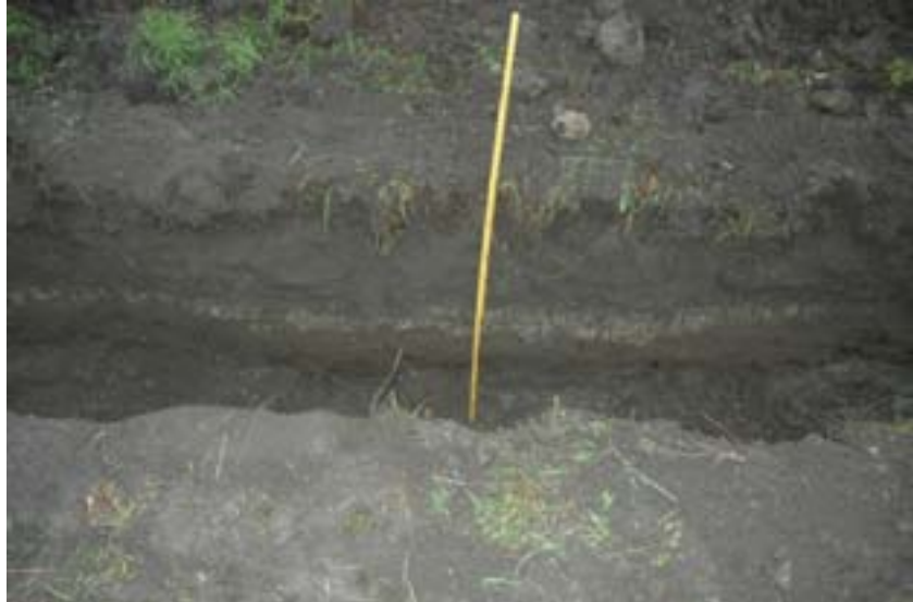
Figur 4. Lerlagret på sträckan +10,10 till +13,80.

även fanns tidigare i schaktet. Det gula lerlagret tolkades som ett byggnadslager/rivningslager, vilket kan ha påförts området.