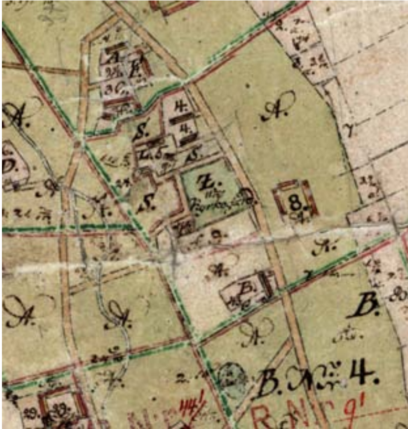
Figur 3. Karta över Hököpinge från år 1806. Ledningsschaktet drogs söder om kyrkogården och ned till ån som löper parallellt med den västra bygatan.

Av 1806 års karta framgår att det funnits en väg precis väster om kyrkogården (fig. 3). Av intresse för denna undersökning är att vägen svängt av rakt åt väster, ned mot ån.