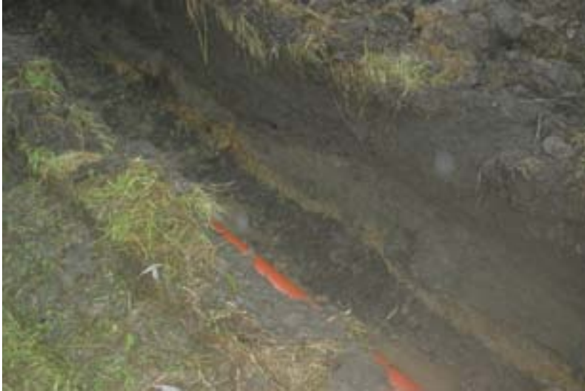
Figur 5 (överst). Lerlagret i botten på schaktet på sträckan +16,7 fram till +21 meter.