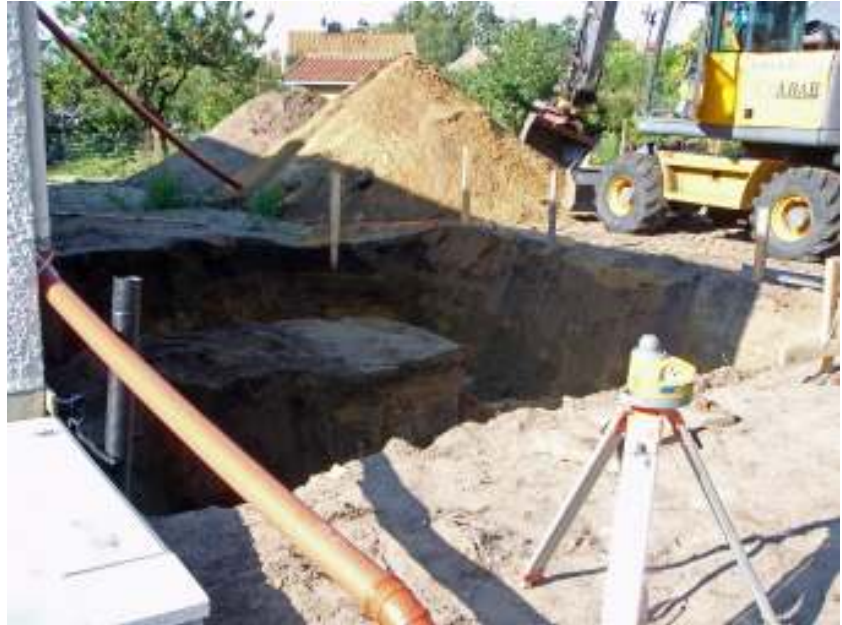
Fig. 4. Schakt 1 fotograferat åt väster. Se detalj av sektion i nordvästra hörnet i fig. 5.