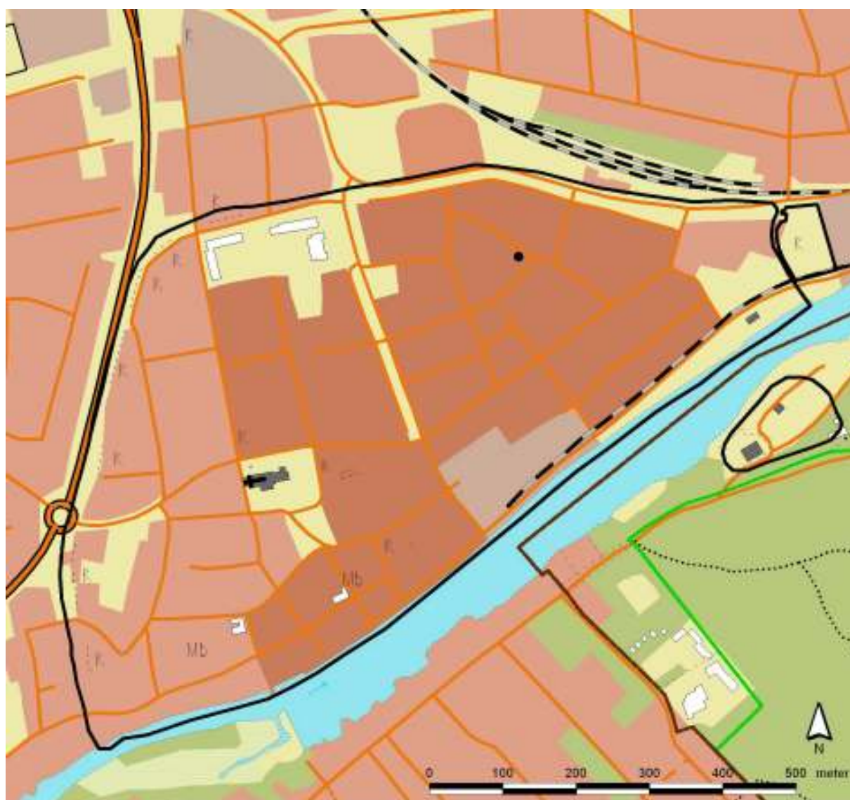
Fig. 2. Läget för Kv Månen 4 inom Åhus medeltida stadsområde markerat med svart punkt.