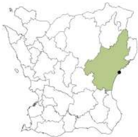
Fig. 1. Skånekarta med Kristianstad kommun och Åhus markerade.