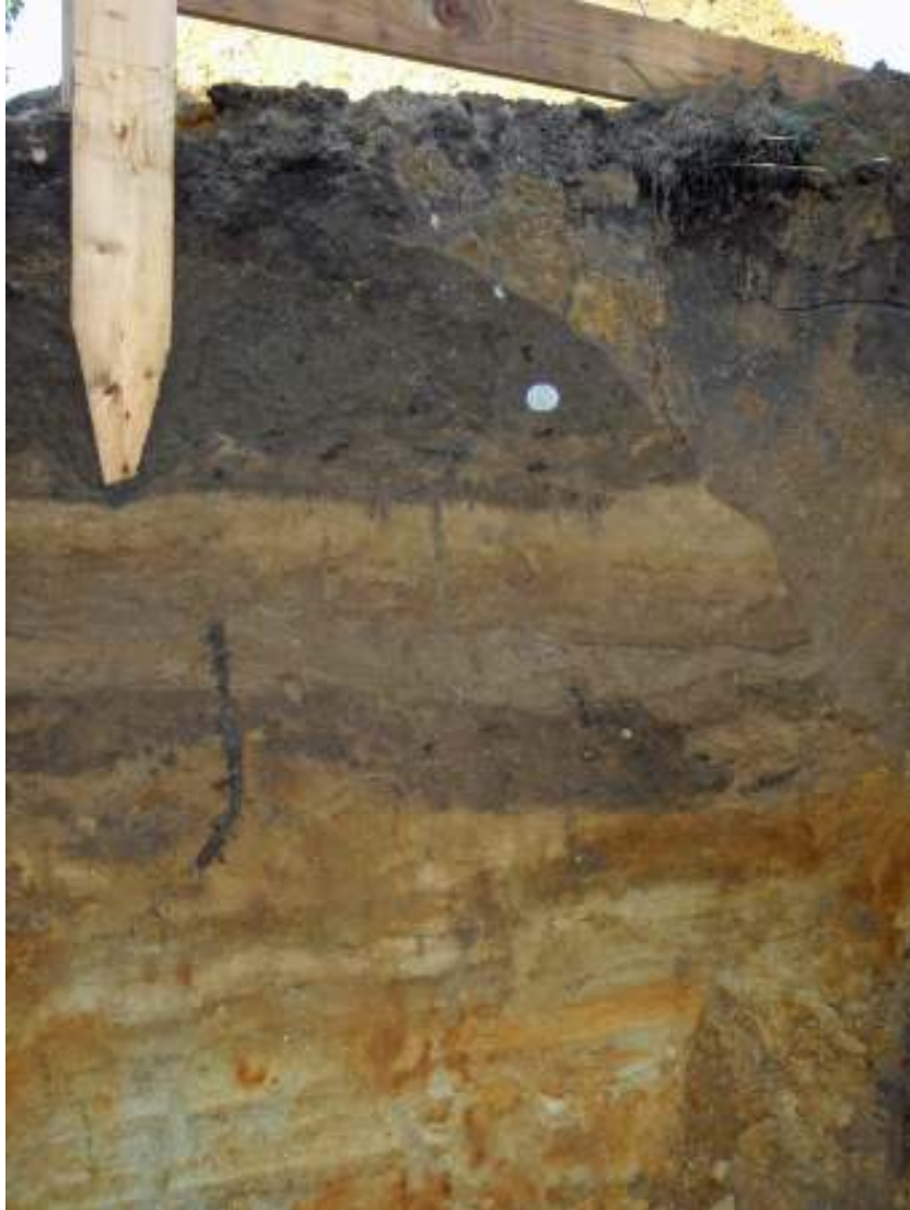
Fig. 5. Lagerföljden i schakt 1. Jämför med fig. 4.

tande lagerbildningar och att det endast finns spridda nedgrävningar i området. Det bedöms som värdefullt att framtida mark-ingrepp står under arkeologisk bevakning för att få en bättre bild av lämningarna, framförallt i kvarterets västra del.