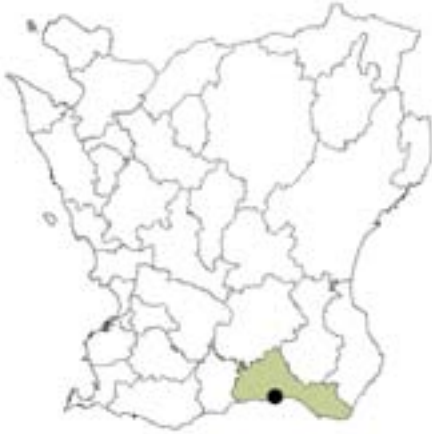
Fig. 1. Ystad i Ystad kommun, Skåne.