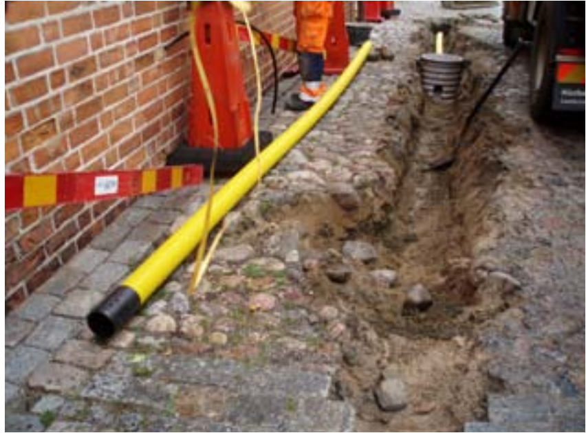
Fig. 3. Schakt A längs med södra sidan av kyrkan.

Schakt B var ca 37 m långt och hade ett maxdjup om 0,5 m. De översta 0,25 m bestod av påförda massor. I den södra delen av schaktet framkom en del rasmassor snarlika de som återfanns söder om kyrkan. I materialet fanns även ett inslag av vingtegel. Längs med kyrkans nordmur påträffades även en del redeponerat gravmaterial.