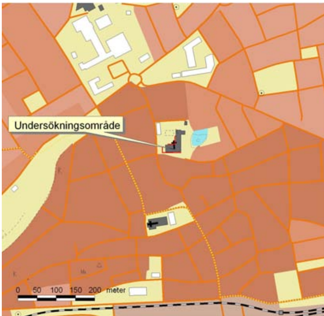
Fig. 2. Ystad kloster med schakten rödmärkerade. Utdrag ur fastighetskartan, blad 1D 9e.