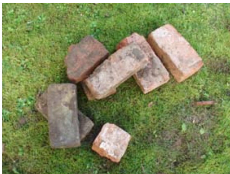
Fig. 6. Tegel som framkom i schaktet.