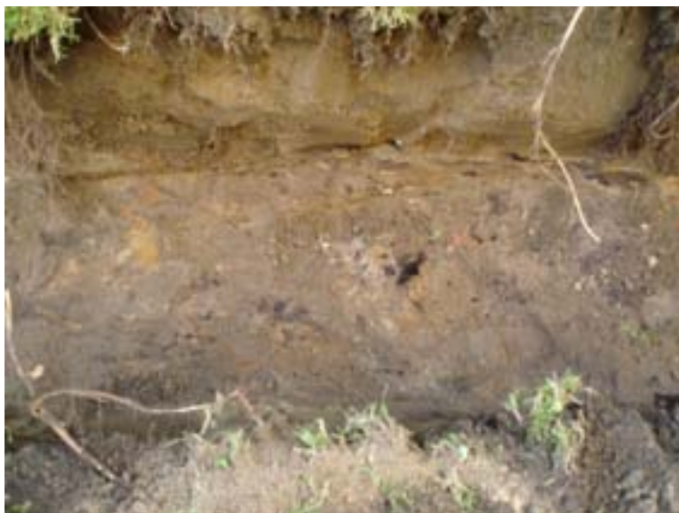
Fig. 5. Kulturlager på ca 0,5 meters djup (se fig. 3:1).