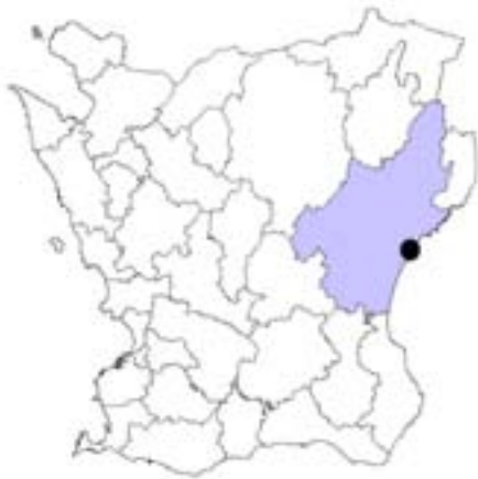
Fig. 1. Åhus i Kristianstads kommun, Skåne.