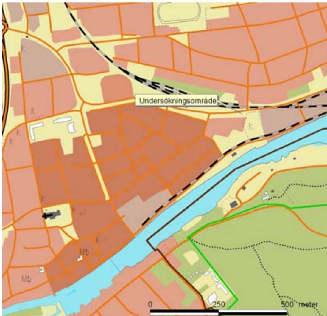
Fig. 2. Undersökningsområdet markerat. Utdrag ur fastighetskartan, blad 3E 0b.