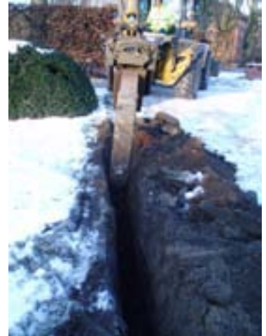
Fig. 3 Schaktet genom pestkyrkogården.

Vid grävningens arbetet grävdes ca 120 löpmeter schakt med ett djup om 0,4-0,5 m och en bredd om 0,3-0,5 m. De första ca 40 m gick genom ett område som markerats som pestkyrkogård från 1711. Hela denna sträcka övervakades. Under moderna bärlager om ca 0,2 m samt mörkbrun humös sand om ca 0,2 m framkom en brungul grov sand. Inga gravar eller annat av antikvariskt intresse påträffades. Resterande sträcka schaktades under anmälningsplikt och inte heller här framkom något av antikvariskt intresse.