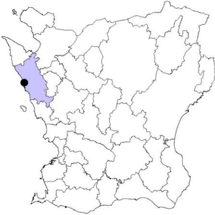
Fig. 1. Helsingborg i Helsingborgs kommun, Skåne.