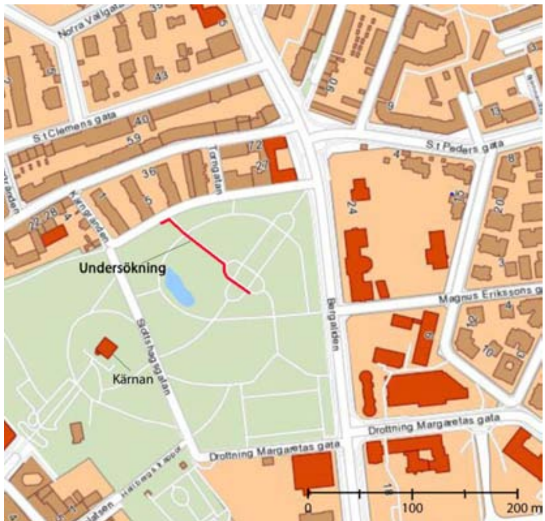
Fig. 2. Schaktets läge i förhållande till Kärnan.