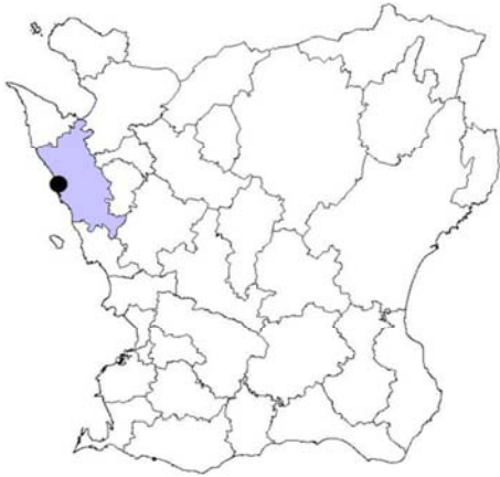
Fig. 1. Helsingborg i Helsingborgs kommun, Skåne.