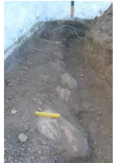
Fig. 3. Kyrkans grund sköt ut vid kyrkans västra del.

Från den östra sidan om vapenhuset grävdes ett schakt ca 100 meter rakt söderut (se fig. 2. siffra 3). Omkring 30 meter söderut fanns en koncentration av obearbetad marksten, sannolikt dittransporterad (se fig. 2. siffra 4).