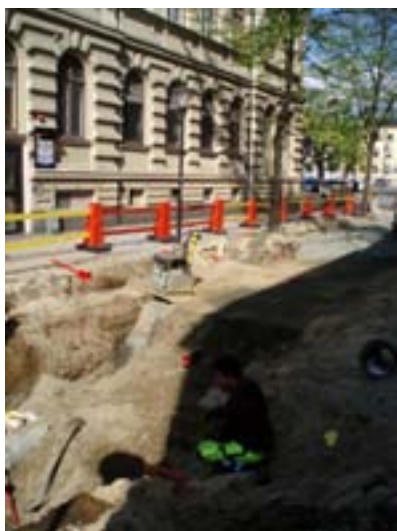
Fig. 4. Ställvis påträffades horisonter av vad som kan tolkas som äldre vägytor.