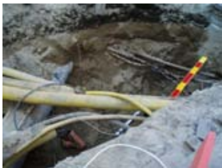
Fig. 3. Till övervägande del gjordes markingreppet i befintliga ledningsgravar.

Schaktet var 4–5 m brett och upp till 2,5 m djupt. Det kunde konstateras att arbetet till största del gjordes i befintliga ledningsschakt. Endast partiellt kunde bevarat kulturlager dokumenteras i form av horisonter av mörkbrun sand under moderna bärlager. Sannolikt skall dessa tolkas som äldre vägytor eller bärlager för äldre vägytor.