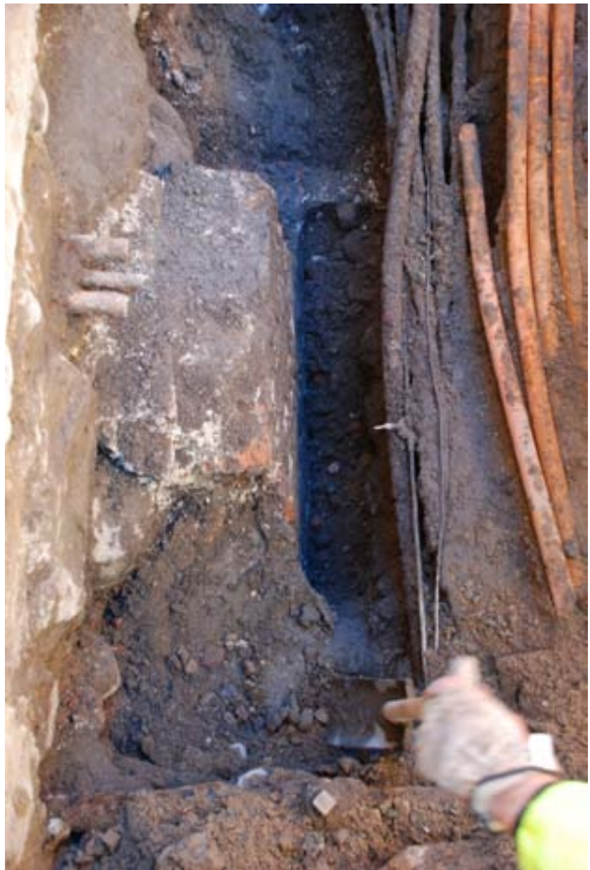
Figur 5: Fotografiet visar de två murresterna efter den senmedeltida källarnedgången. Den kraftiga muren med minst två skift tegel syns centralt i bilden. Den mindre muren löper i 90° vinkel i förhållande till den borte begränsningen på den stora murresten.

tida källarnedgång. Ca 0,5 meter under markytan framkom en mur av storstenstegel som sträckte sig ned ca 1,4 meter. Muren var 0,8–0,9 meter tjock (se figur 5 och omslag). Vinkelrätt mot denna mur gick en klenare mur in under Kansligatan. Även denna var lagd med storstenstegel. Murresterna utgör med största sannolikhet en yttre källarnedgång som eventuellt kan kopplas till senmedeltida bodverksamhet. Den tredje provgropen upptogs intill trappan på husets framsida. Inget av antikvariskt intresse framkom.