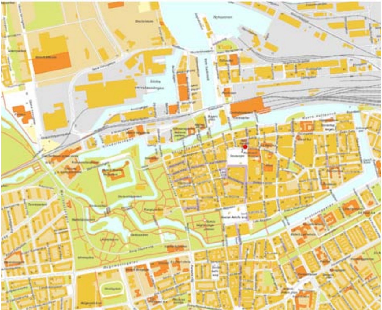
Figur 2: Karta över del av Malmö med undersökningsplatsen markerad med röd punkt.