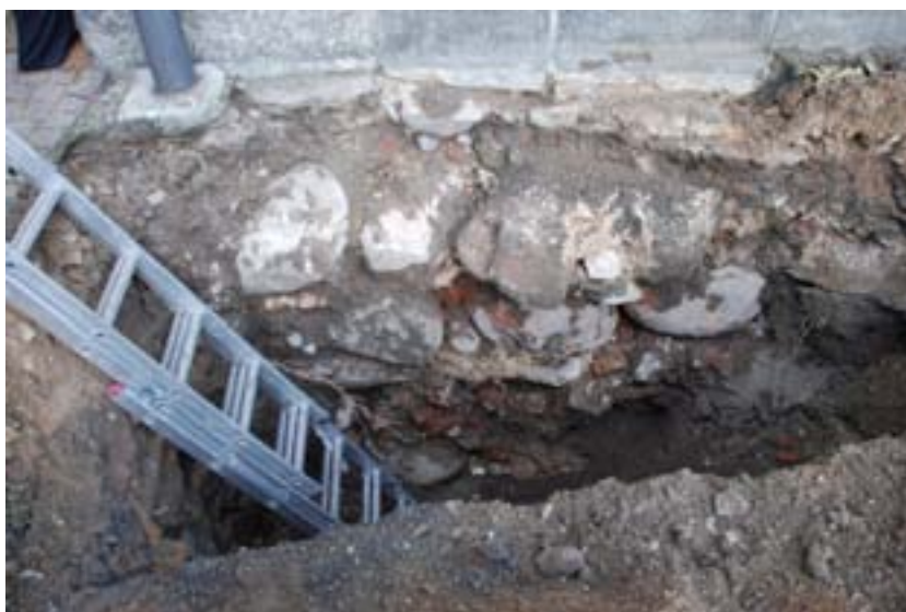
Figur 3. Fotografi över provgrop 1.

Kvarteret Residenset är beläget i de centrala delarna av Malmös äldre bebyggelseområde. Det har inom detta område utförts ett flertal arkeologiska undersökningar, och flera schaktövervakningar. I det aktuella kvarteret har genomförts olika kabelarbeten och byggschaktningar. Vid dessa arbeten har påträffats grundmur av tegel och gråsten (Malmö Museer arkivnr 042:01) och tegelvalv (Malmö Museer arkivnr 042:02). Vid en undersökning under ledning av Malmö Fornminnesförening år 1912 påträffades lämningar efter bebyggelse såsom gårdsplan, trappor, rännsten och byggnader av tegel och kritsten. Vid samma tillfälle framkom brandlager och tånglager. Lämningarna daterades till 1600- och 1800-tal (Malmö Museer arkivnr 042:03).