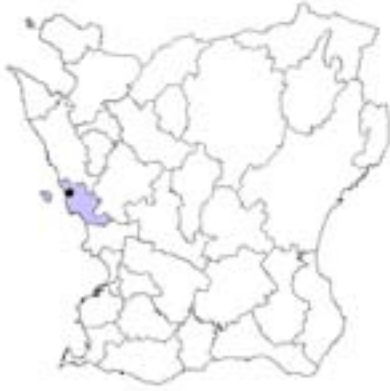
Fig. 1. Skåne med läget för byn Övre Glumslöv markerat (t.v).