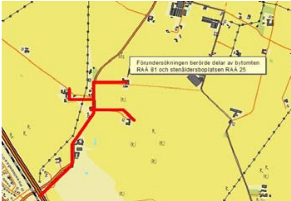
Fig. 3. Utdrag ur fastighetskartans blad 3C1c Kvistofta med förundersökningsschaktens ungefärliga lägen markerade. Skala 1:5000 (nederst).