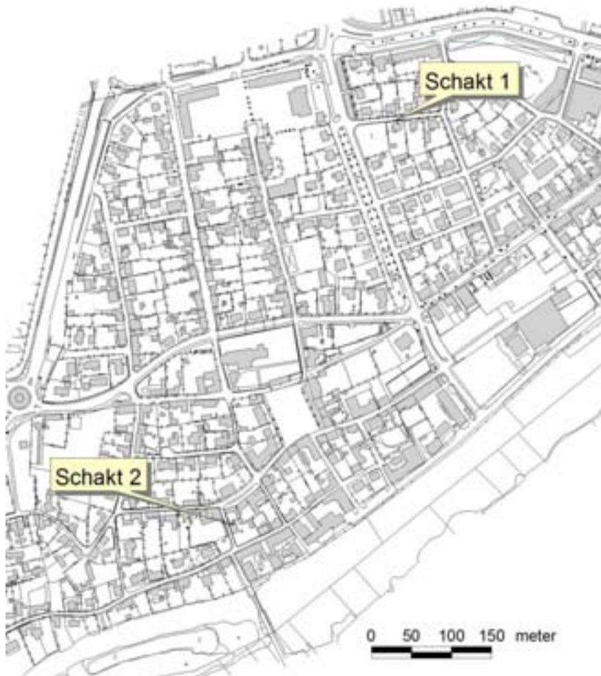
Fig. 2. Schaktens läge i Åhus.