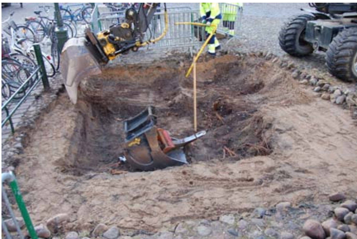
Figur 3. Schaktet från norr.