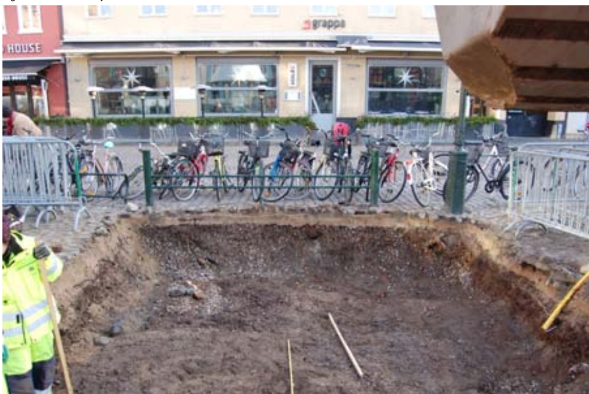
Figur 6. Schaktet från väster.