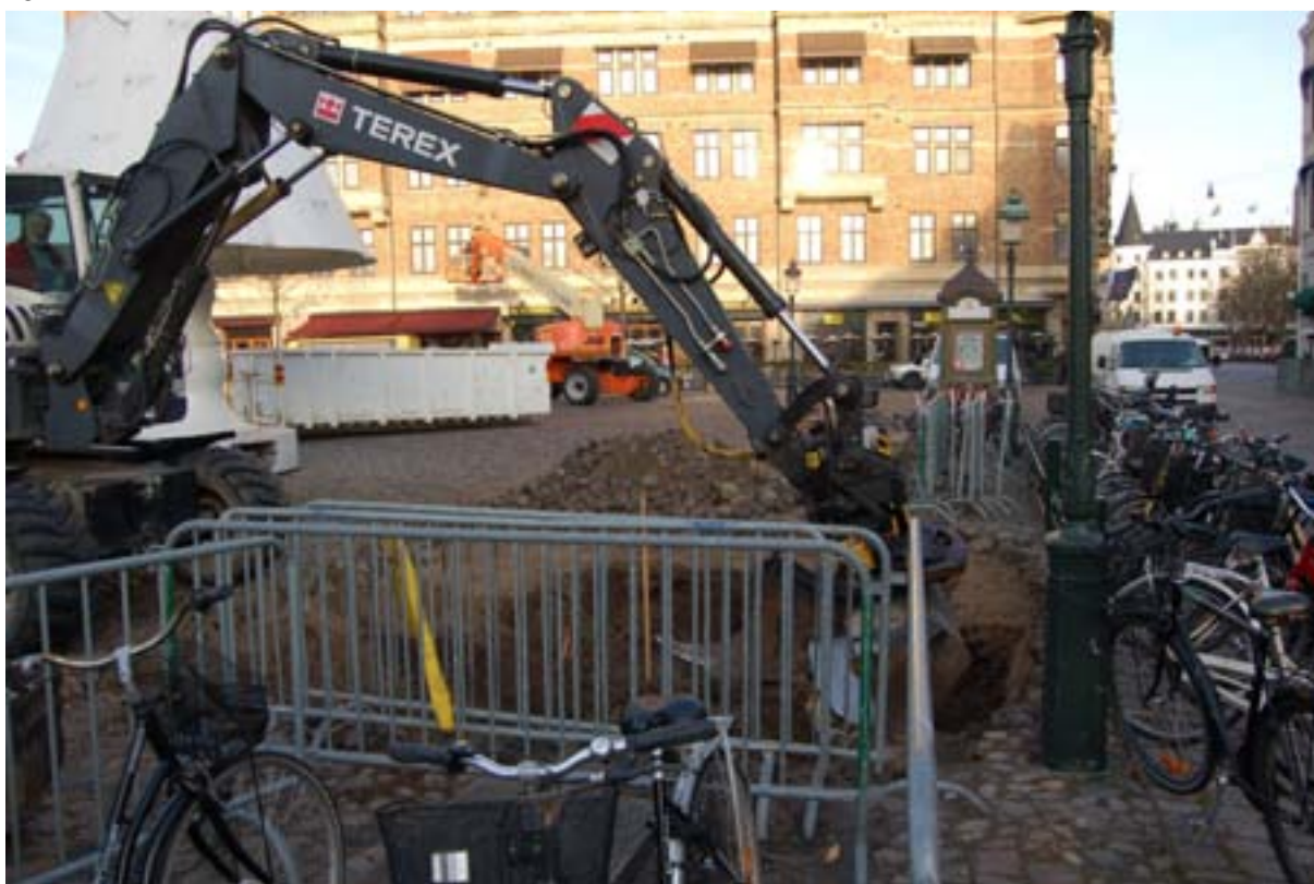
Figur 4. Schaktet från söder.