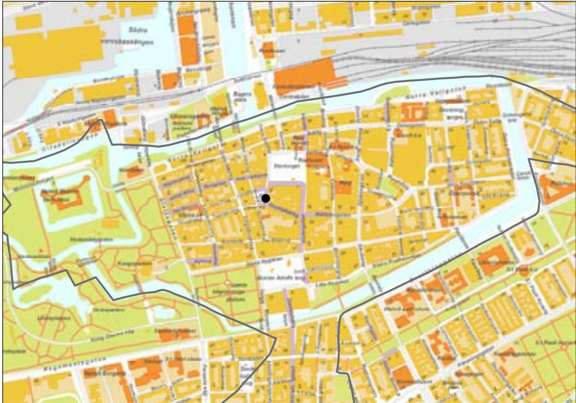
Figur 1. Undersökningens läge i centrala Malmö och inom RAÄ 20 (grå linje).