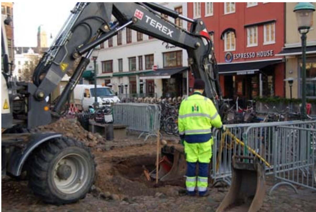
Figur 5. Schaktet från sydväst.