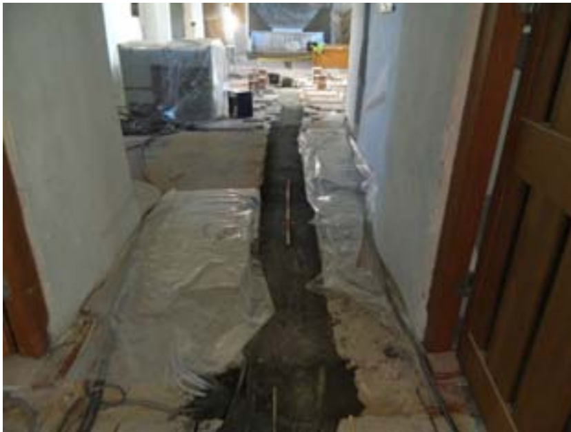
Fig. 5. Den uppbyggda rännan i kyrkgolvet var endast ca 0,2 m djup och innehöll inga synliga äldre golvnivåer eller andra lämningar av arkeologiskt intresse.