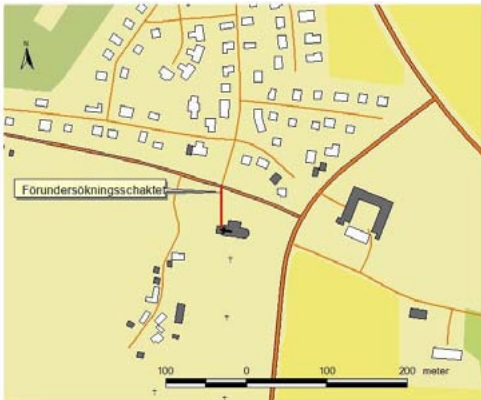
Fig. 2. Förundersökningsschaktet vid Norra Åsums kyrka.