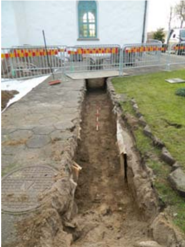
Fig. 4. Fjärrvärmeschaktet sett mot söder. Inga lämningar av arkeologiskt intresse påträffades i det ca 0,8 m djupa schaktet.