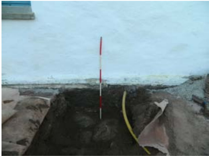
Fig. 3. Fjärrvärmeschaktet invid vapenhusets nordvägg. I schaktet syns fundamentet till det på 1800-talet tillbyggda vapenhuset.

påträffades dock det kraftiga gråstensfundament varpå vapenhusets väggar vilar. Detta fundament härstammar liksom själva vapenhuset från början av 1800-talet. Fundamentet utgjordes av ca 0,4- 1 m stora gråstenar, vilka murats samman med ett gulaktigt och något smuligt kalkbruk. Såväl fundamentet som schaktet ute på kyrkogården mättes upp och dokumenterades genom en rad fotografier. Även det delvis upprivna golvet inne i kyrkan mättes upp och dokumenterades, men då detta golv lades in så pass sent som under 1970-talet påträffades inga lämningar av arkeologiskt intresse (Fig. 3-5).