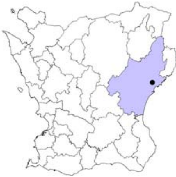
Fig. 1. Norra Åsum i Kristianstads kommun, Skåne