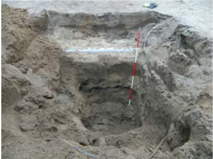
Fig. 3. Schakt 1 från norr. Schaktet visade sig endast innehålla moderna utfyllnadsmassor och redan befintliga ledningar.