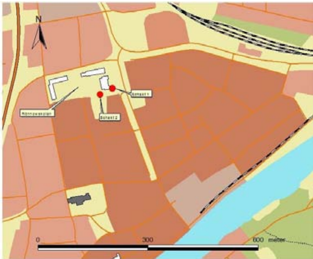
Fig. 2. Undersökningsområdets läge vid Rönnowskolan i centrala Åhus.