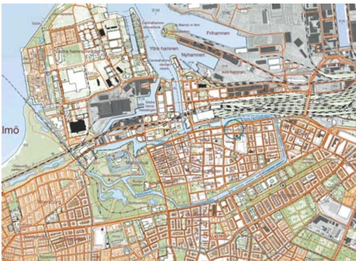
Figur 2. Karta över del av Malmö med Sankt Gertrudsgatan inringat med blått.