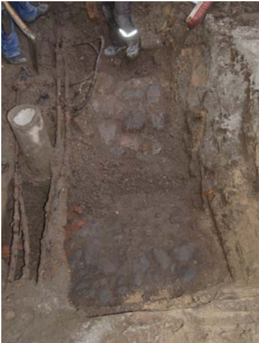
Figur 4: Bilden visar de två stenläggningar som framkom i norra änden av schaktet. Stenläggningen med de större stenarna sluttade ned mot den andra stenläggningen. Söder om stenläggningen kom en sentida avloppsledning som kan ha förstört den. Foto från norr.

nordväst om stenläggningen men det finns inga uppgifter om att det påträffades någon stenläggning i det schaktet. Några år tidigare hade det genomförts en schaktningsövervakning (MHM12837) på exakt samma plats och då hade en kullerstensbeläggning dokumenterats i två sektioner (Heimer 2009). Möjligen kan stenläggningarna kopplas till Heligests torn som omnämns första gången 1475 (Rosborn 1984). Under den första stenläggningen kom ett svart "fett" kulturlager med fynd av enstaka ben. Ovanför stenläggningarna var marken omrörd och ett flertal ledningar löpte i gatans längdriktning. Drygt 30 meter söderut påträffades en större mängd stenar som kan ha ingått i en husgrund. De föreföll dock inte ligga in situ utan har troligen rubbats vid markarbeten och hamnat i fyllningen. Stenarna framkom i skiftet mellan de två hus som ligger längs med gatan. Huset som ligger i den södra delen av schaktet förefaller vara äldre då källarväggen innehöll en blandning av tegel och vanlig sten. En del av teglet utgjordes av storstenstegel (se omslagsbild). I övrigt framkom omrörda massor i schaktet.