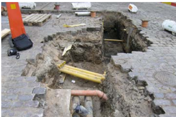
Figur 4. Schaktet sett mot norr.

Undersökningen fortskred under några dagar i feb–mars, under vädermässigt gynnsamma förhållanden. Bevaringsförhållandena för de arkeologiska lämningarna är goda även för organiskt material och därmed även förutsättningen att få ut mer information vid eventuella framtida insatser.