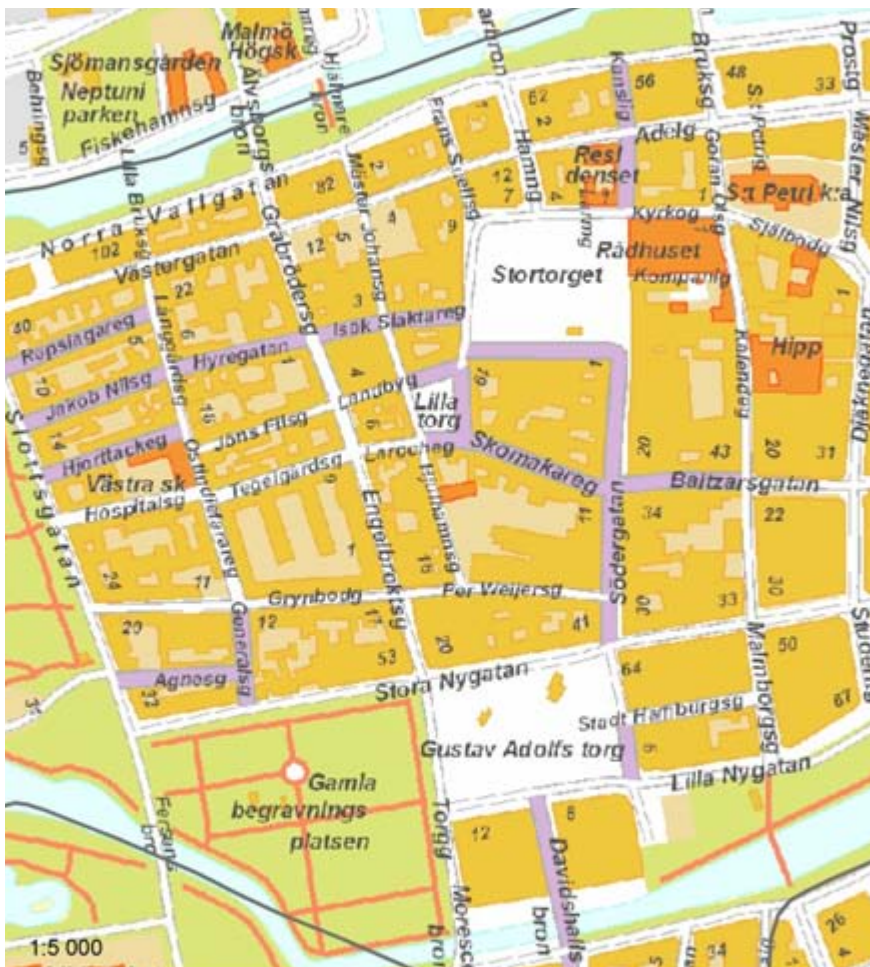
Figur 2. Lilla torgs placering centralt i bilden. Skala 1:5 000.