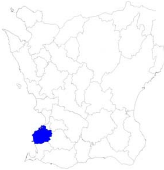
Figur 1. Karta över Skånes kommuner med Malmö kommun markerat med svart.