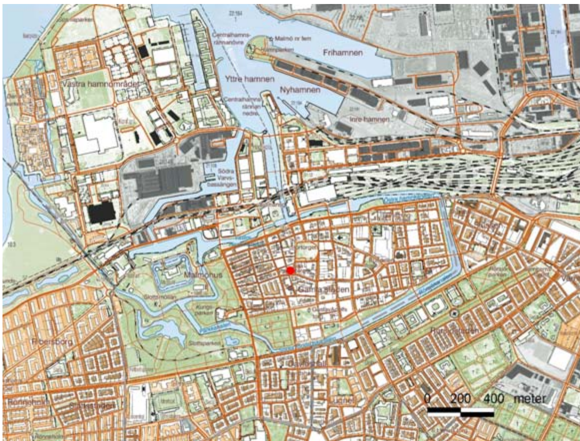
Figur 2. Karta över del av Malmö med Lilla torg centralt i kartan.