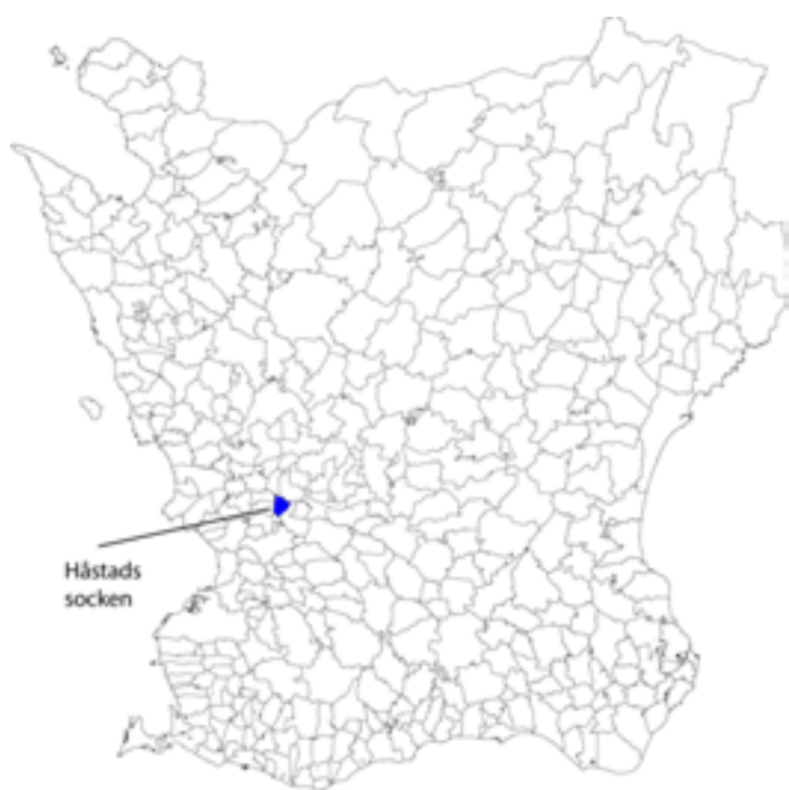
Fig . 1.Håstads socken i Skåne.