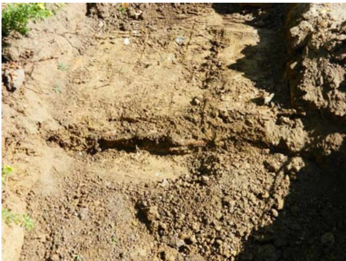
Fig. 4. Grav 1 under framgrävning. Graven låg direkt under matjorden.