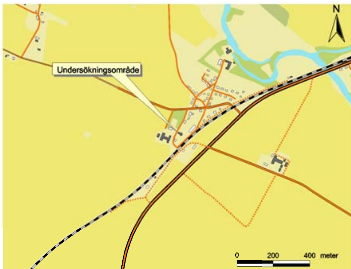
Fig. 2. Undersökningsområdets läge (utdrag ur fastighetskartan).