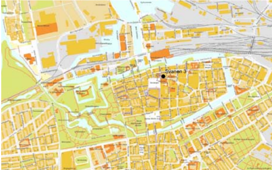
Figur 1. Undersökningens läge i Malmö äldre stadsområde, skala 1:20 000.