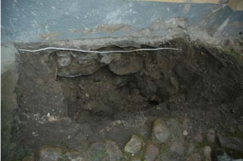
Figur 3. Schaktet invid husväggen med den instabila grundmuren delvis synlig.