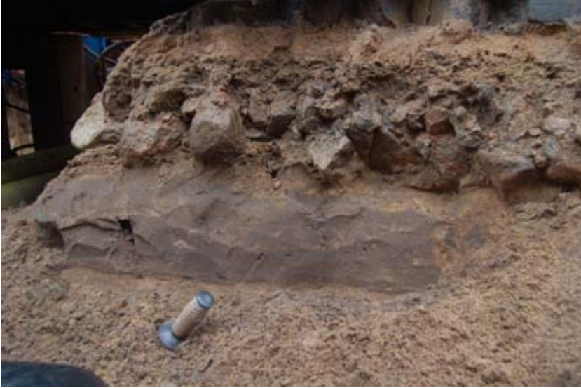
Figur 4. Fotot visar en sektion genom Storgatan. Överst syns sättsanden för dagens gatsten. Under den låg ett lager med grov grus direkt på den äldre kullerstensbeläggningen som låg i sättsand direkt på en äldre matjordshorizont.