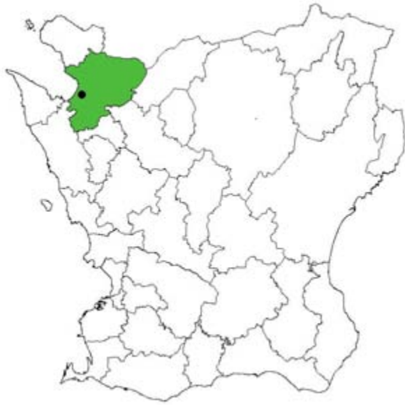
Figur 1. Karta över Skåne med Ängelholms kommun och Ängelholm utmarkerade.