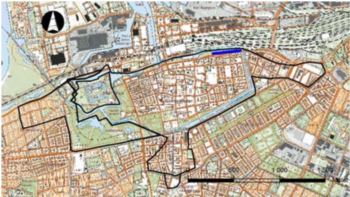
Figur 2. Karta över centrala Malmö med gränsen för fornlämning 20 markerat med kraftig svart linje. Undersökningsområdet är markerat med kraftig blå linje.