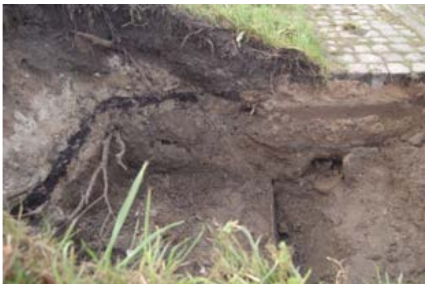
Figur 4. Fotot visar dels kajskonningen i form av en plankan i nederkanten av fotot, dels de avgrävda kuturlagret till vänster i bilden.