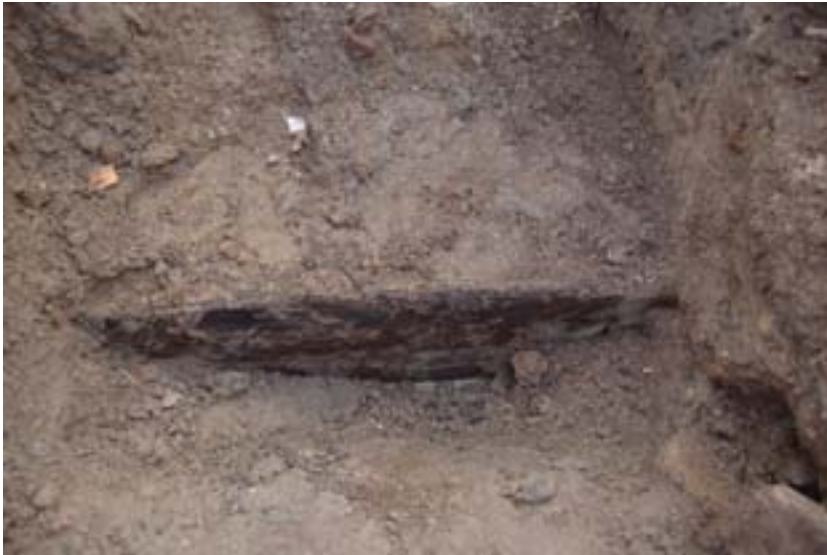
Figur 3. Den liggande plankan som framkom i Provgrop 2 och som tolkas som rester efter den tidigare Uppsalakajen

Den planerade utvidgningen av Uppsalakajen innebär att kajkanten flyttas längre ut i kanalen och ingreppen i fornlämningen inskränker sig till omläggning av dagvattenledningar. Enligt entreprenören är det möjligt att lägga om rören utan att påverka de orörda delarna av Uppsalakajen.