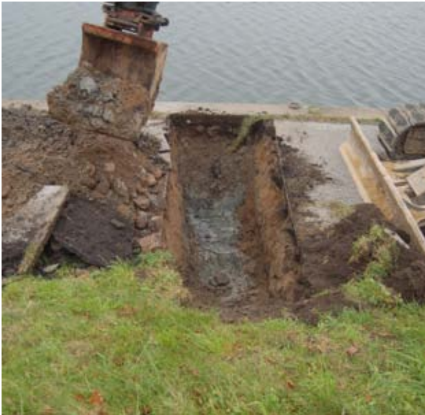
Figur 5. Fotot visar provgrop 1 med det mörkgrå dyiga lagret som kan vara en rest efter en äldre vallgrav.