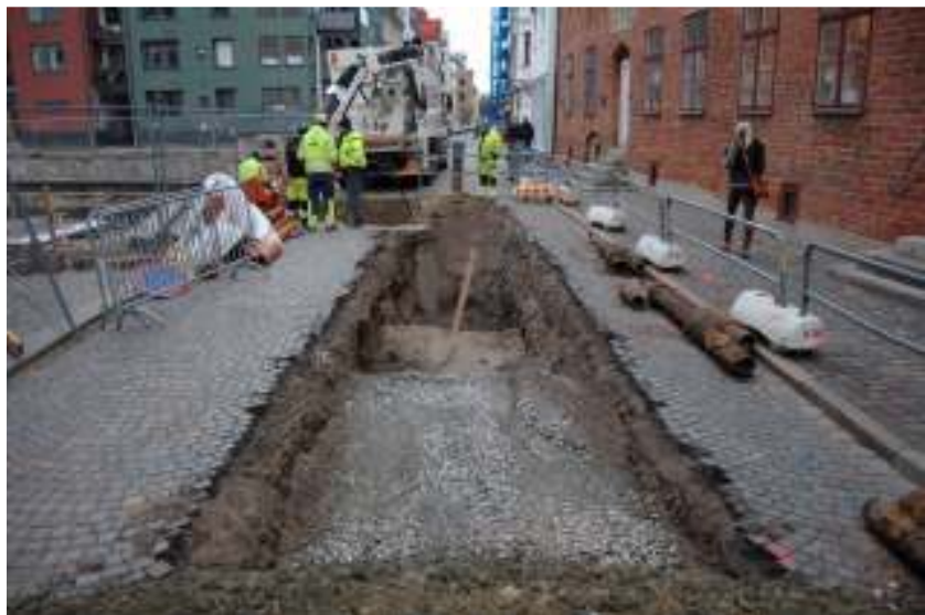
Figur 5. Schaktet i Västergatan, mot väster.

I den mellersta delen av schaktet, ute i Västergatan, samt in mot kvarteret Frans Suell kunde man tydligt se att de äldre schaktningarna gått ner i den sterila bottensanden.