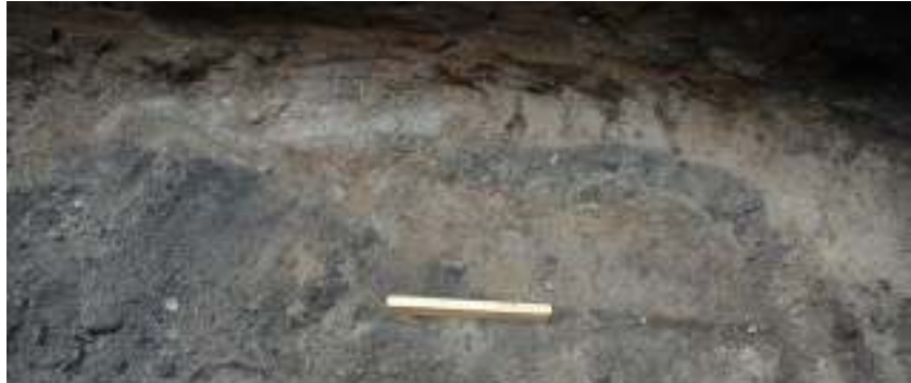
Figur 4. Lerbotten synlig mot bottensanden.