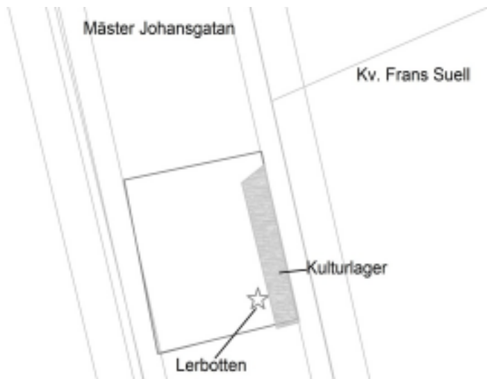
Figur 3. Schaktet på Mäster Johansgatan