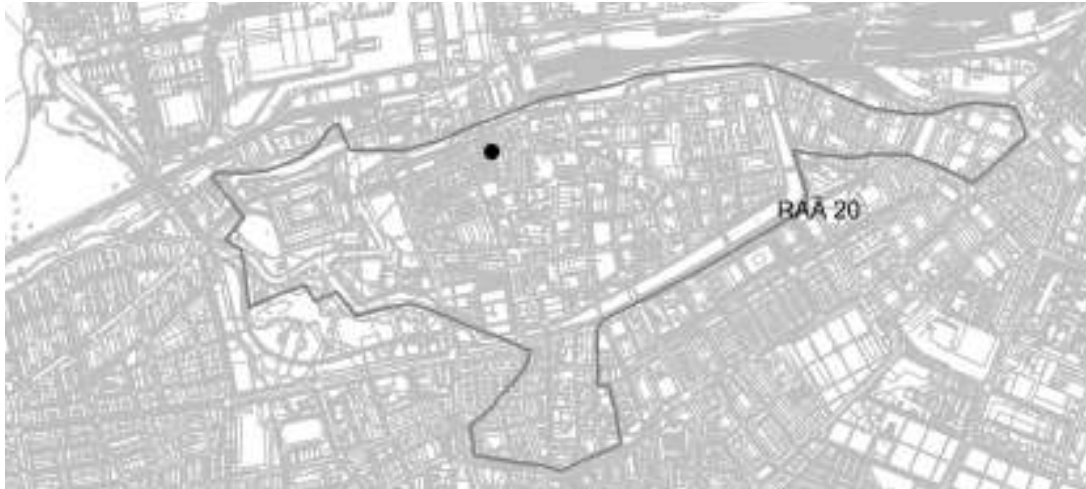
Figur 1. Schaktens placering i förhållande till RAÄ 20.