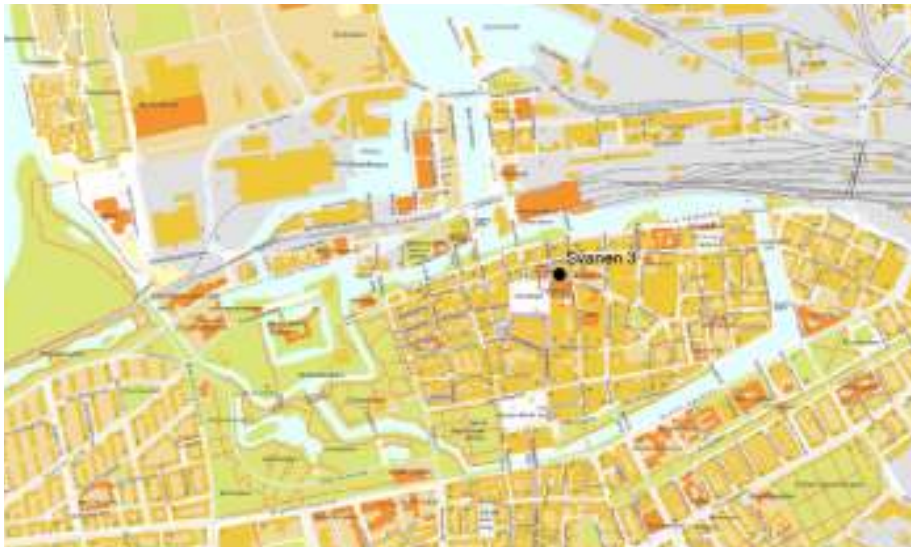
Figur 1. Undersökningens läge markerat med svart prick.