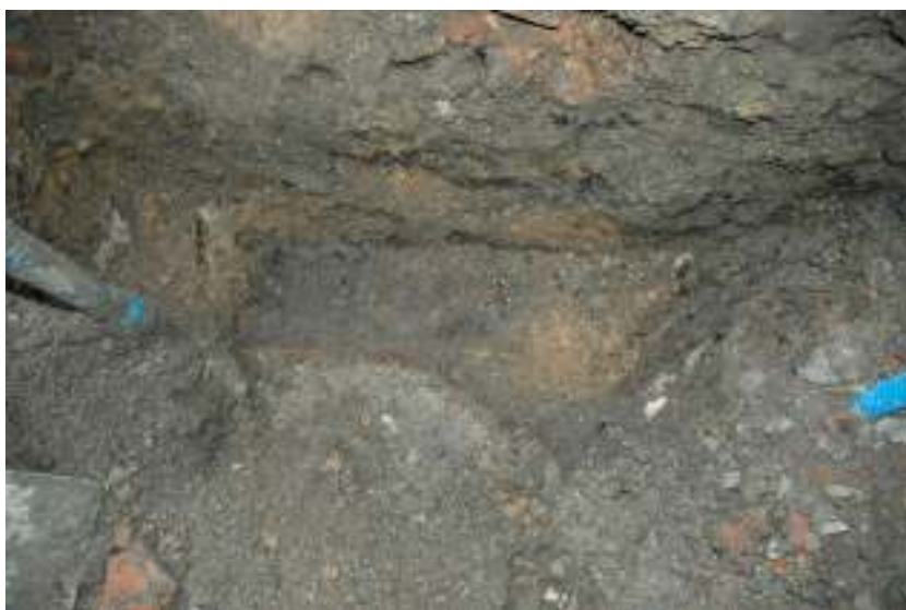
Figur 4. Möjlig träkonstruktion i östra delen av schaktet.

I schaktets östra del påträffades en möjlig träkonstruktion som