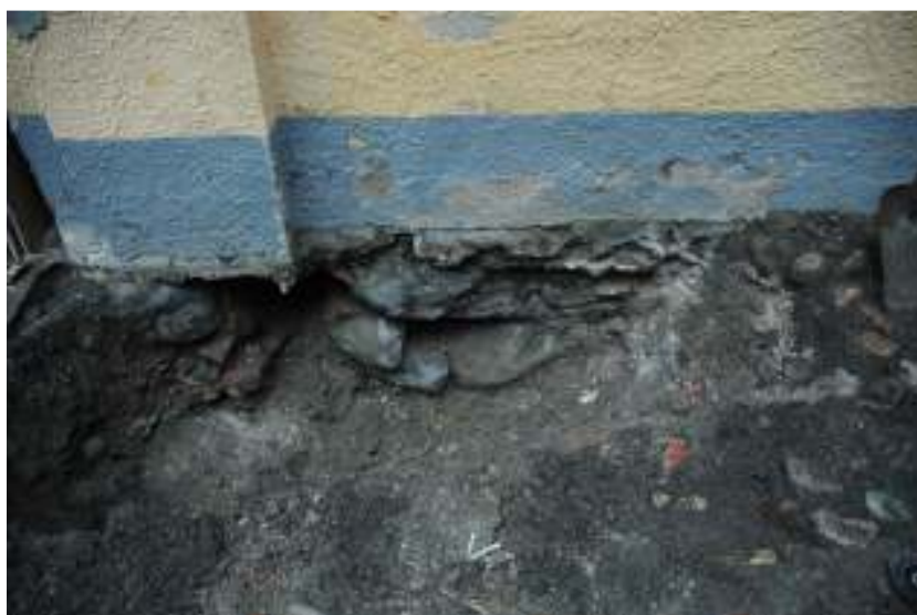
Figur 3. Första delen av schaktet sett från norr.