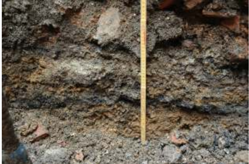
Figur 5. Sektion mot öster.

syntes som en brun lins med en ganska homogen fyllning i form av grå sandig silt. Denna undersöktes ej mer än i ytan då det ej skulle grävas djupare. Den östra sektionen uppvisade kulturlager som såg ut att vara möjliga brandlager, lerlager (golv?) och ett sandlager som kan vara spår av ett sättsandslager.