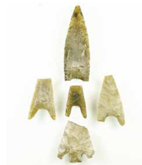
Pilspetsar från stenålderns slut-bronsålderns början. De är samtliga skadade vilket tyder på att de använts. Den undre har en tånge, något som visar på kontinentala förebilder. Den övre, längsta pilspetsen, är ca 4,5 cm lång.

Under den senare delen av bronsåldern, från strax före 1000 f.Kr och framåt genom järnåldern, blev spåren inom Stenbergiska tomten färre. Det betyder inte att människor inte bodde i trakten, bara att de ytor vi undersökte användes på ett annat sätt än tidigare. Enstaka eldstäder visar att man vistades här tillfälligt. Kanske var det herdar som tände lägereldar inför natten. Det är inte förrän staden Simrishamn börjar växa fram som ytan åter tas i anspråk mer stadigvarande.