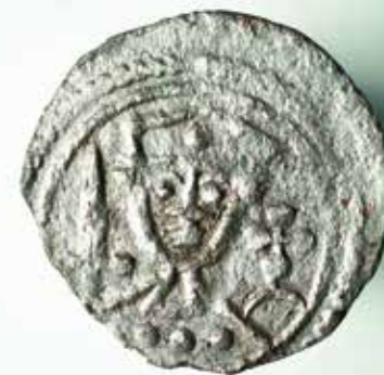
Silvermynt, präglat för Valdemar II (1202–1241).