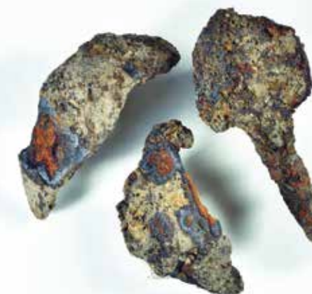
Små järnkrampor (sintels), använda till att fästa drevningen i en hanseatisk kogg.