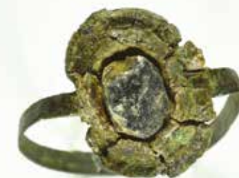
Fingerring av brons med en infattad, ursprungligen röd sten.