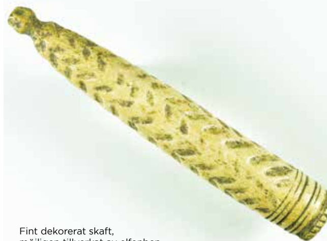
Fint dekorerat skaft, möjligen tillverkat av elfenben.