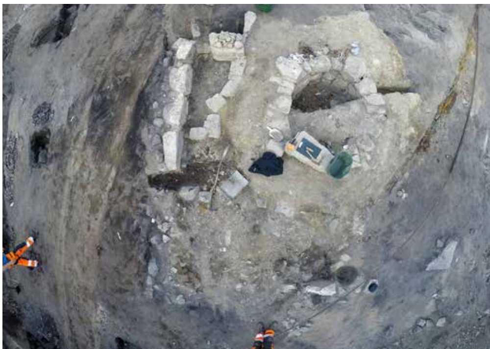
Den medeltida byggnadens stengrund och golvlager. Den blev delvis förstörd på 1700-talet när man satte ner gårdsbrunnen invid den nybyggda huslängan.

Även i kvarteret Lars Johan märktes hur bebyggelsen expanderat. Redan då vi undersökte brandtomten med georadar på försommaren 2017 hade en regelbunden struktur i den övre kanten av slutningen observerats. Men eftersom den stora stensatta brunnen till 1700-talets Stenbergiska gård låg på samma plats var det inte lätt att tolka detta eko. Emellertid skulle stengrunden och golvnivåerna från en medeltida byggnad komma att friläggas här – en upptäckt man inte riktigt hade förväntat sig. De bevarade delarna av den södra väggsyllan mätte 5,2 meter men byggnaden har sannolikt varit större än så. Huset har haft minst två rum