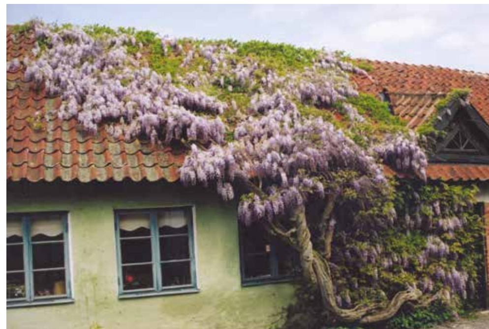
Närhelst man under sommaren passerade den Stenbergiska längan stod det någon och fotograferade det magnifika blåregnet. När våren efter branden kom kunde man se att blåregnet inte helt hade gett upp. Den rest av växten som kunde räddas står nu vid en brandhärjad mur inne i trädgården och kommer att kunna glädja åtminstone boende i det nyuppförda kvarteret.

Efter att brandmassorna hade avlägsnats våren 2017 återstod inte speciellt mycket av 1700-talsgårdens bostadslänga. Kvar fanns den stabila terrasskanten i sluttningen, en stenmur som möjliggjort att en plan byggyta kunnat skapas. Vid själva utgrävningarna fann vi emellertid fler spår som visade hur man gått tillväga när huset uppfördes. Där fanns stenar utlagda vilka hade burit mellanväggarnas syllträn, samt fundament till skorstenar och eldstäder. Intressantast var nog det 30 centimeter tjocka lerlager som lagts ut på hustomten efter att denna schaktats av.