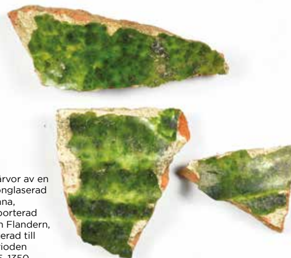
Skärvor av en grönglaserad kanna, importerad från Flandern, daterad till perioden 1175–1350.

Fynd av mynt och tidstypisk keramik placerar huset i högmedeltid, det har fungerat från tidigt 1200-tal till en bit in i följande sekel. Utifrån fyndmaterialet och de analyser som gjorts förefaller byggnaden snarast ha utnyttjats som kök och bostad. Andelen ben från spädgris var anmärkningsvärt hög, men även får eller get, gås, höns och torsk förekommer bland matresterna. Ingenting tyder på att huset brukats som verkstad. Vad vi däremot såg var spåren efter dess övergivande. För en tid har huset stått tomt och öde eftersom ett lager av flygsand hamnat över golven,