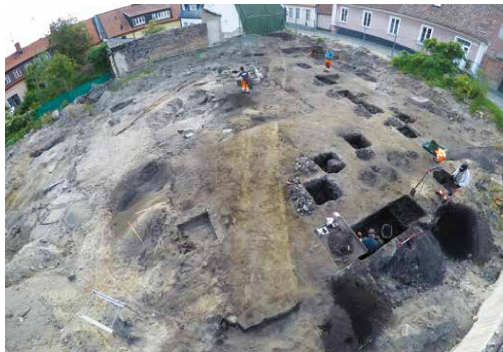
Tvärs över utgrävningen löpte de två hjulspåren, fyllda av ljus flygsand.

lar snarast om en händelse, om ett fruset ögonblick. Vid något tillfälle har en vagn färdats till eller från stranden. Man har valt att köra längs den branta nordsluttningen. Det är en begriplig reaktion; den som färdas utnyttjar en naturlig ledlinje i terrängen. Hade det varit fråga om en verklig väg, ett stråk som brukats kontinuerligt, skulle det inte ha funnits något distinkt vagnsspår som avtecknat sig i sanden. Då hade vi frilagt ett myller av hjulspår som skurit och korsat varandra. Kanske hade det rentav utbildats en så kallad halv väg där