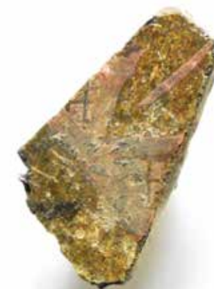
Målat medeltida fönsterglas, en skärva från S:t Nicolai kyrka?