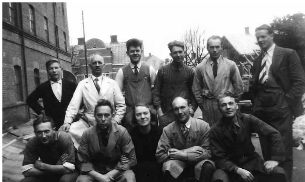
Personal i Stenbergs möbelsnickeri och affär. Till höger Stenbergska gården och till vänster väggen till det som en gång var Esperssonska grynkvärnen.

bostad, salt eller färskt kött eller fisk samt soppa eller grynvälling. Eftermiddagskaffet klockan tre bjöds utan tillbehör och sedan var det gröt till kvällsmat. Förutom mathållningen skulle Mästarinnan också hålla ordning på lagret och se till att det man behövde av råvaror fanns hemma.