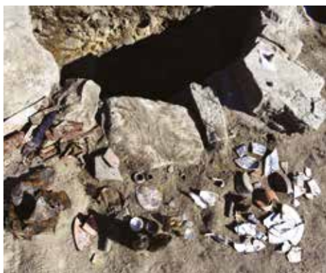
En hälsning från Stenbergiska gården – det noga stensatta karet till gårdsbrunnen och lite av det skräp man slängt ner då brunnen fylldes igen omkring 1910.

inblåst sand som i sin tur har täckts av rasningsmassor från rivningen av huset.