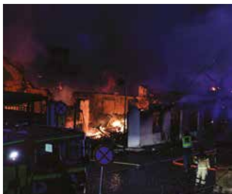
Ystads Allehandas fotograf Torun Börtz var snabbt på plats och kunde fånga lågorna som reste sig höga mot den mörka morgonhimlen.