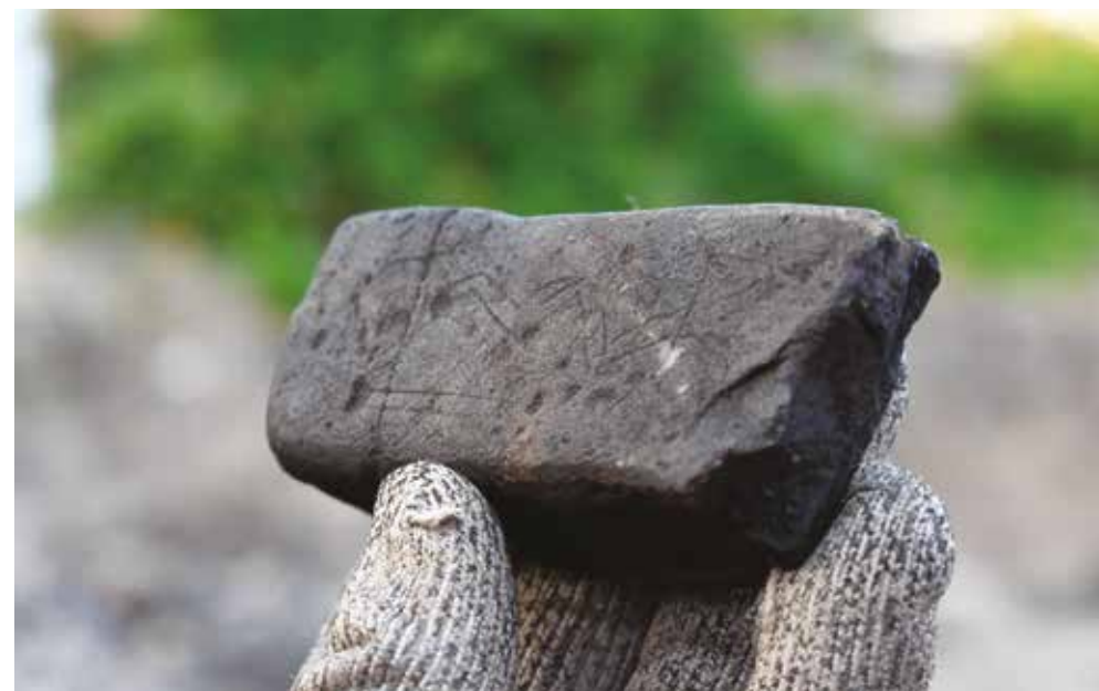
Ristad sten. Ovanför tummen parallella linjer och högre upp parallella sicksack-linjer.

En liten, men fantasieggande koppling till Simrishamnstraktens hållristningar upptäcktes bland all den sten som marken var full av. Bland de tusentals stenar vi grävde fram, och i de flesta fall direkt slängde åt sidan, föll blicken på en sten med en flat yta där svaga spår av ristningar framträdde. Det geometriska mönster som ses på stenen kan i viss utsträckning jämföras med mönster på några av gravhällarna i det stora röset vid Kivik, Bredarör, och på en praktfull rikt dekorerad bronsyx från Borrbytrakten. Stenen, som med lätthet kan hållas i en vuxen persons hand, ger en vardaglig förankring av ett