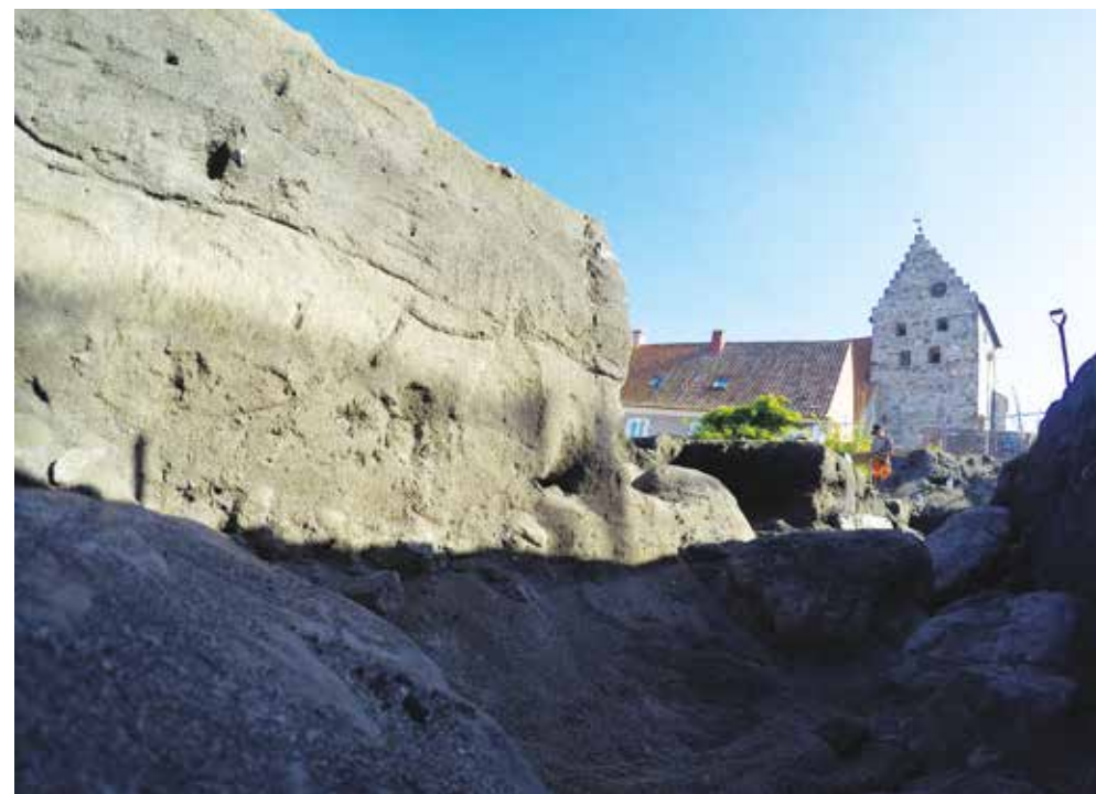
Stenålderstrand. På bilden ses ett mörkt sandlager som vilar på en stenig botten. Här hittades flera fynd från tiden kring 3000 f.Kr. Ovanpå detta anas ett tunt ljus sandlager som i sin tur täcks av ännu ett mörkare lager. I detta fanns rikligt med fynd från slutet av stenåldern och början av bronsåldern, omkring 1000 år yngre än fynden från det undre lagret.

Kring 4000 f.Kr. påbörjades en ekonomisk förändring i Sydskandinavien – odling och boskapsskötsel började få betydelse. Introduktionen skedde över ett antal hundra år, men ur ett ekonomiskt perspektiv fick jordbruket inte sitt tydliga genomslag förrän efter 3800 f.Kr. Jordbrukets införande skedde genom en komplex dynamik mellan inhemska anammande och inflyttande människor från kontinenten. De förde med sig så-