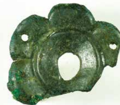
Ströning – litet bronsbeslag att sy fast på tyg eller läder.