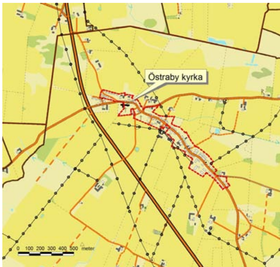
Fig. 2. Östraby kyrka i Östraby. Utdrag ur fastighetskartan, blad 2D 6d.