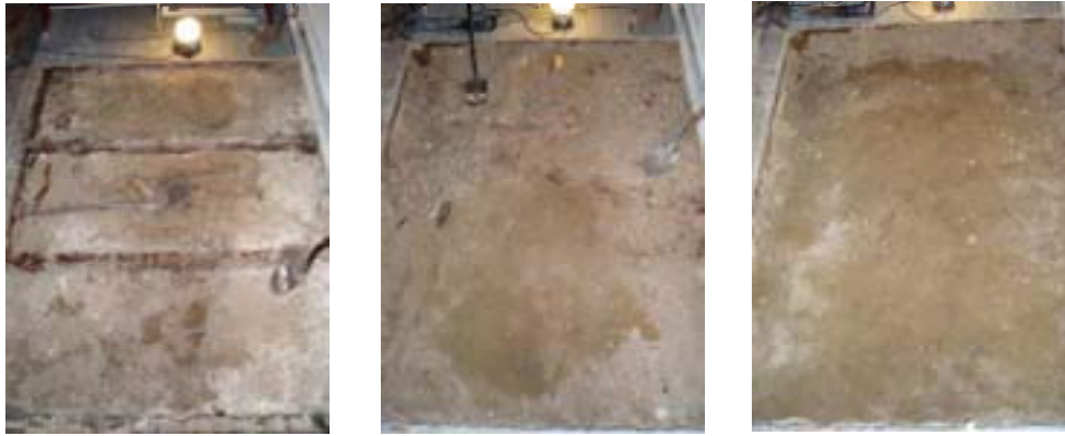
Fig. 4. Längst till vänster syns golvbjälkarna i rivningslagret; i mitten syns rivningslagret; längst till höger syns sandhorisonten, tillika schaktets botten. Samtliga foton tagna från öst.