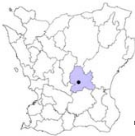
Fig. 1. Östraby i Hörby kommun, Skåne.