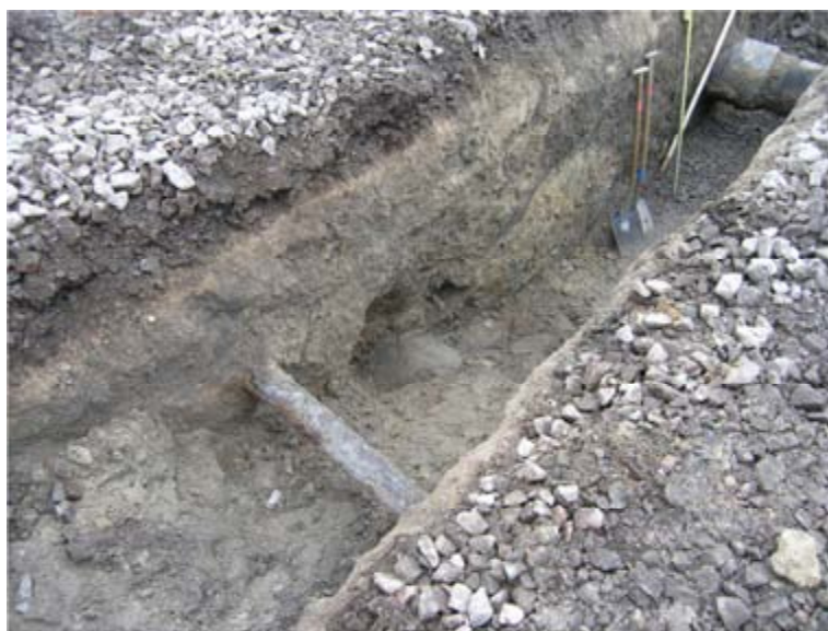
Figur 1. Rörledningsdiket i vilket benen påträffades. Foto från NO.

Personal från PEAB påträffade vid grävningsarbeten på bangården till Malmö Centralstation ett antal människoben. Efter kontakt med Länsstyrelsen fick Sydsvensk Arkeologi AB i uppdrag att inspektera fyndet. Det visade sig att det rörde sig om människoben, minst 3 individer. Det kunde konstateras att benen var funna i fyllningen till ett rördike, och sålunda ej in situ. Läget för benfyndet mättes in och en sektion rensades och ritades. Trots att området var kraftigt påverkat av dikesgrävning och övriga markarbeten verkade det som att det fanns orörd mark mellan nedgrävningarna. En tolkning är att man vid ledningsarbete stött på gravar, vilka återbegravts i fyllningen till diket. En annan tolkning är att det inte är orörd mark i området, utan utfyllnadsmassor, och att benen hamnat på platsen med utfyllnaden, vilken sedan genomgrävts av diken varpå benen redeponerats. Fyndplatsen ligger ca 35 meter norr om Malmö Roddklubbs lokaler och ca 55 meter norr om Norra Vallgatan, sålunda i ett (tidigare) strandnära läge.