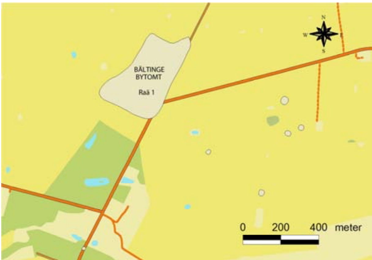
Undersökningarna gjordes i anslutning till väggorsningen Skarhult – Kungshult – Östra Strö