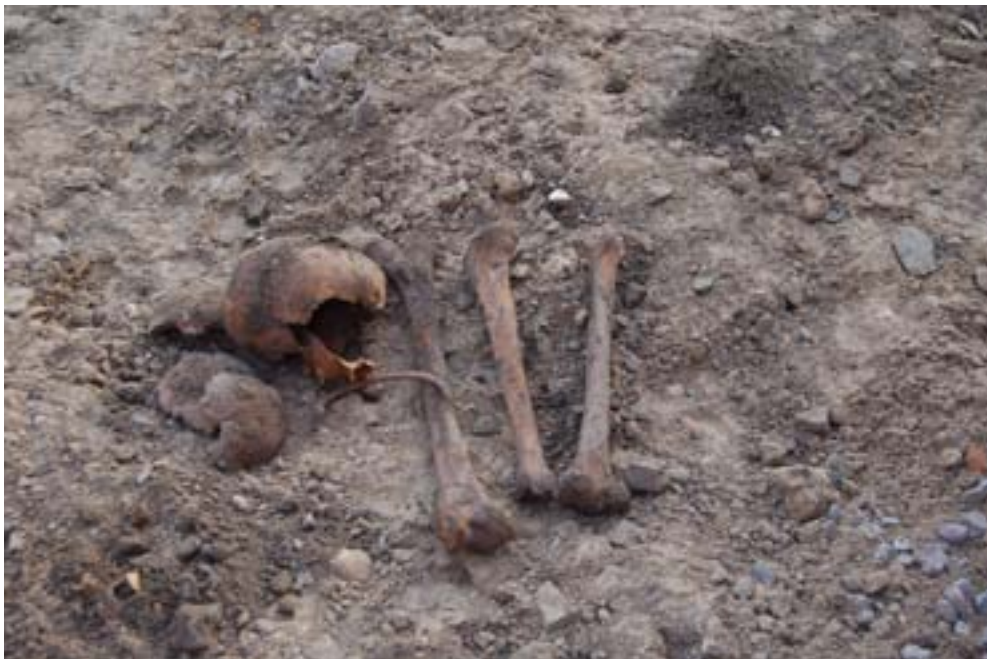
Figur 5. Benfynden.