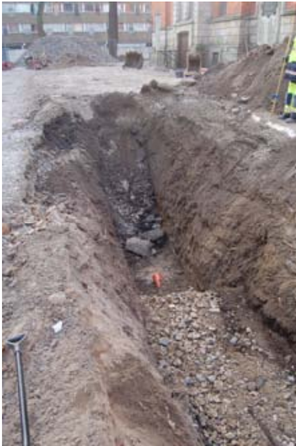
Figur 4. Schaktet från N.