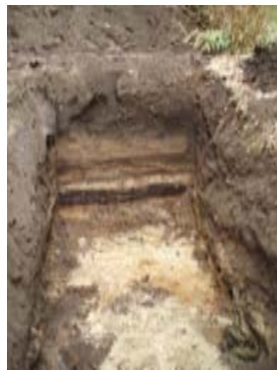
Fig. 5. Foto av sektionen från Ö.