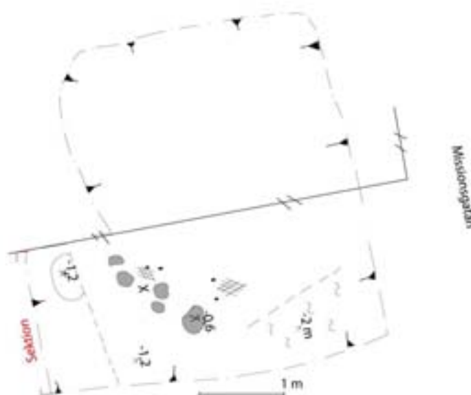
Fig. 3. Schaktet sett i plan. X=fyndplats för järnskälla.