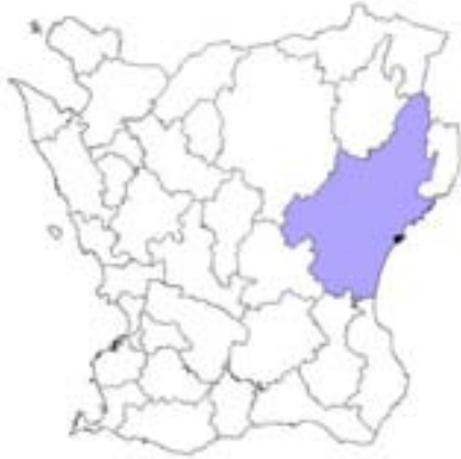
Fig.1. Åhus i Kristianstad kommun, Skåne.