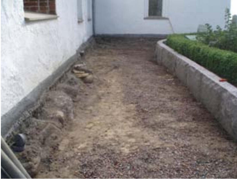
Fig. 4. Sydvästra delen av långhuset från väst. Till vänster i bild syns utskjutande grundstenar och till höger i bild syns nysatt kantsten.