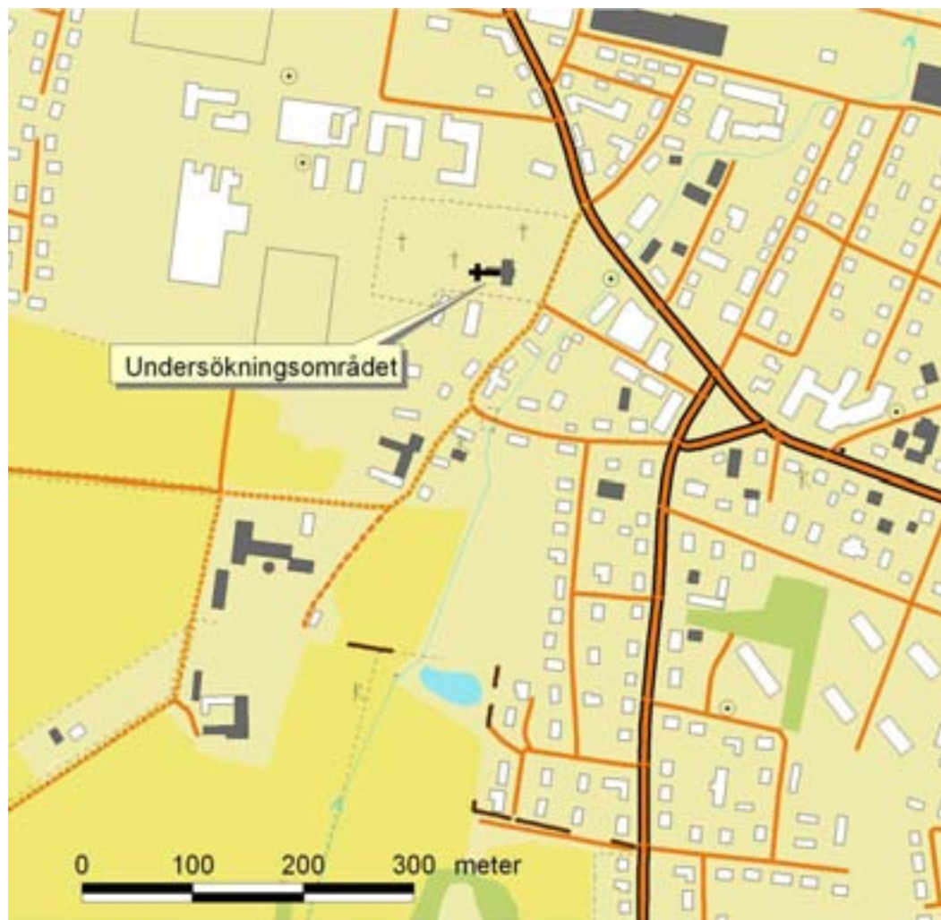
Fig. 2. Undersökningsområdets läge i Veberöd.