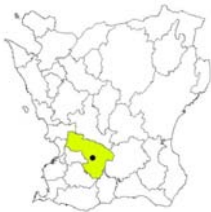
Fig.1.Veberöd i Lunds kommun, Skåne.