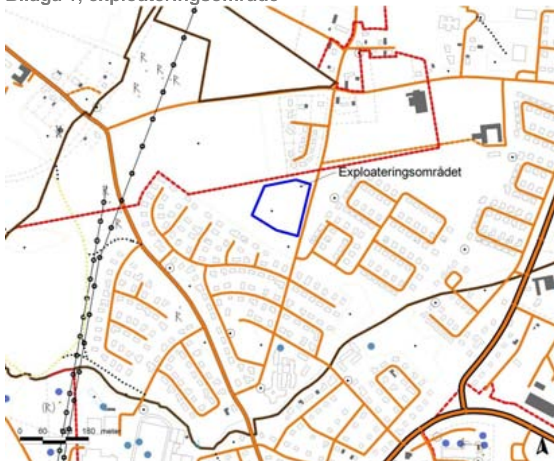
Utdrag ur fastighetskartan med exploateringsområdet markerat