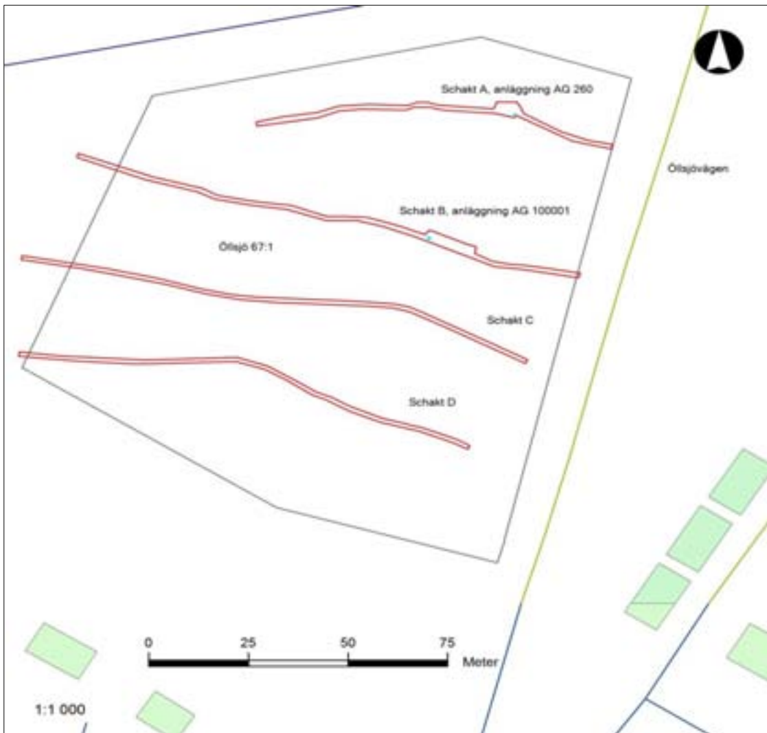
Fig 2. Öllsjö 67:1, utredningsschakt och funna anläggningar