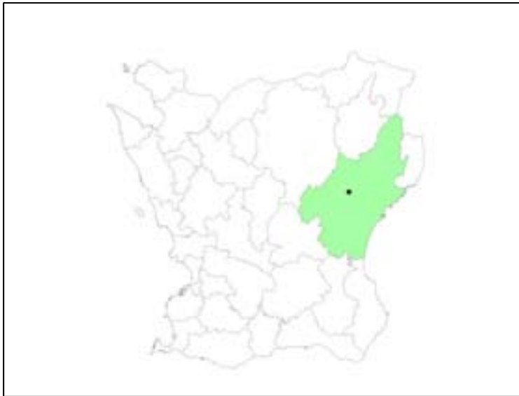
Fig 1. Skåne med Öllsjö i Kristianstad kommun markerat