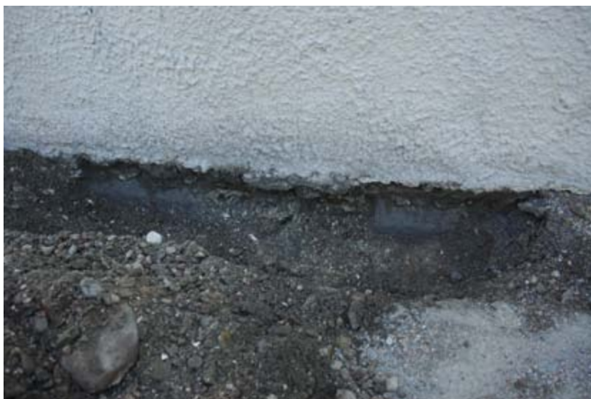
Figur 3. Profilerade stenar under marknivå i tornets nordvästra del.

Uppdragsgivare var Malmö kyrkliga samfällighet.