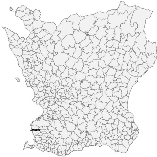
Figur 1. Västra Klagstorp socken, i Skåne, markerat med svart (skala 1:1 500 000).