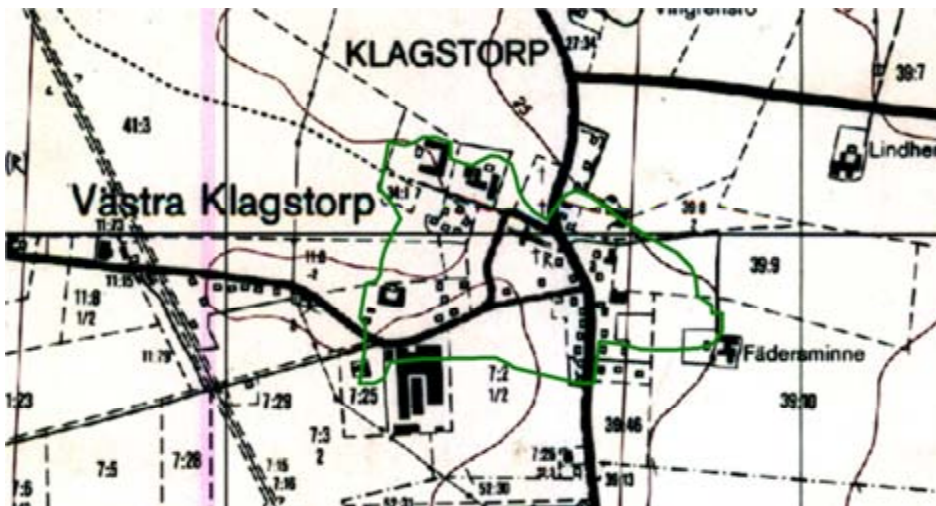
Figur 2. Västra Klagstorp på Gula kartan. Bytomtsområdet markerat med grön linje, skala 1:10 000