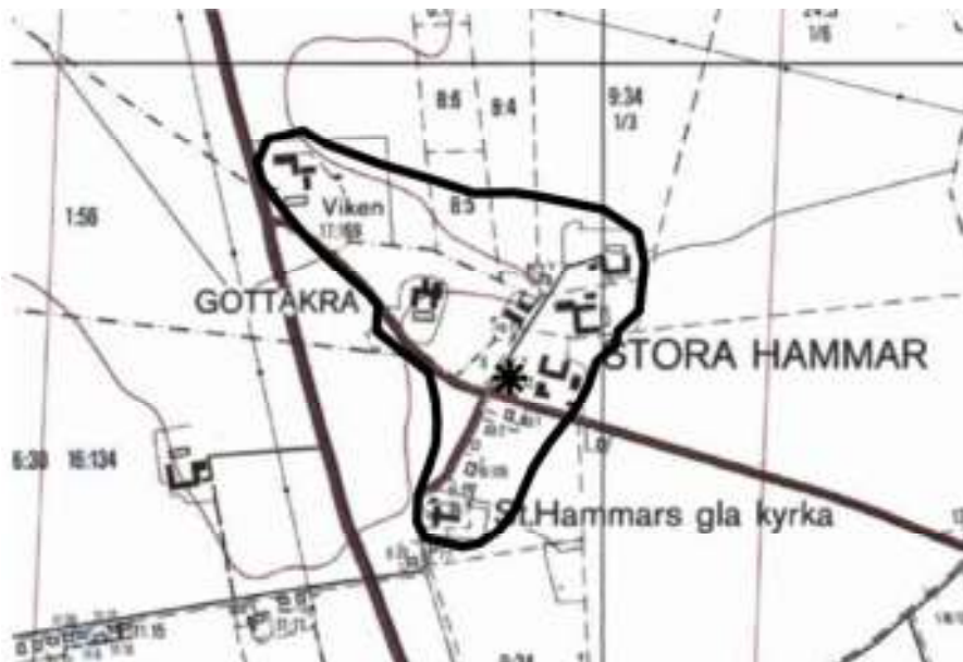
Figur 2. RAÄ 13 markerat med svart linje och undersökningsområdet markerat med stjärna.